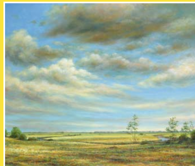
Drentse Aa (olieverf)

Erik van Ommen schilderijen . etsen . tekeningen