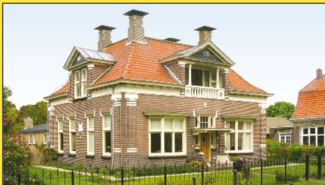
De voormalige pastorie